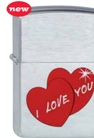
new I Love You 200.119 #200 · 29,50 €