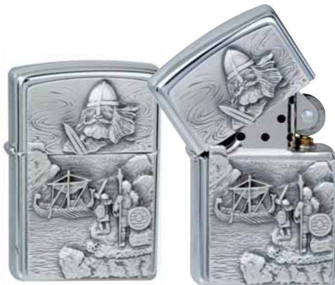
Viking Spirit 300.095 #200 · 39,50 €