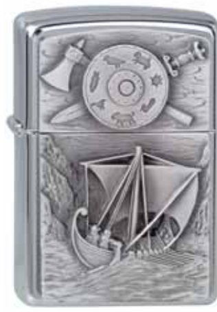
Viking Foray 300.094 #200 · 39,50 €