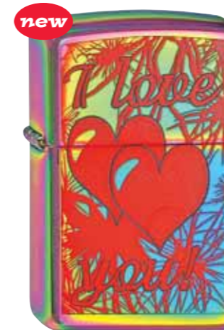
new I Love You 240.067 #151 · 45,00 €