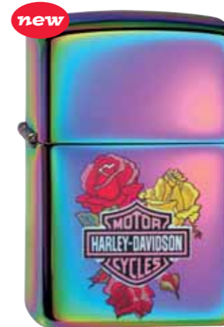
new Harley-Davidson Roses 240.065 #151 · 55,00 €