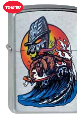
Tiki-Surfer 230.037 #207 · 39,50 €