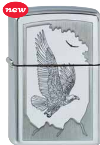
Birds of Prey 110.053 #250 · 39,50 €

The trademarks BEAM®, JIM BEAM®, JIM BEAM and Design® and the Jim Beam bottle design™ are used here under license from Jim Beam Brands Co.