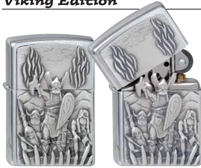
Warriors 300.092 #200 · 39,50 €