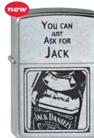
Jack Daniel's Ask for Jack 230.031 #207 · 39,50 €