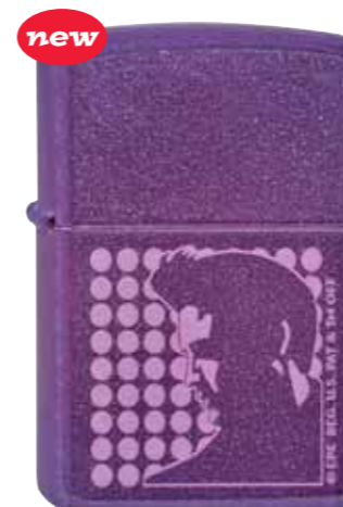
Elvis Silhouette 290.047 #21065 · 39,50 €