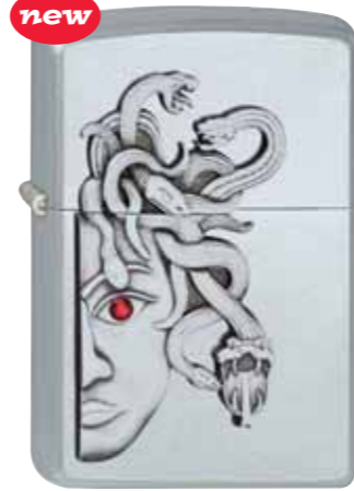
Seductive Serpents 320.043 #205 · 59,50 €