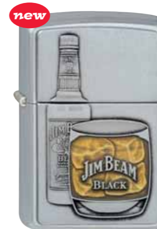
Jim Beam Bottle w/Glass 320.046 #205 · 59,50 €