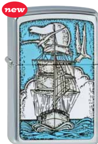
new Tall Ship 210.076 #250 · 45,00 €