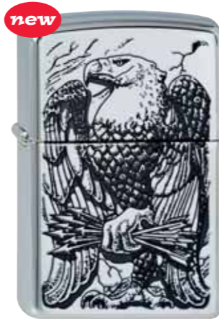
new Monumental Eagle 210.077 #250 · 45,00 €

© 2006 Barrett-Smythe all rights reserved