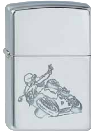
Victory Rider 110.052 #250 · 35,00 €