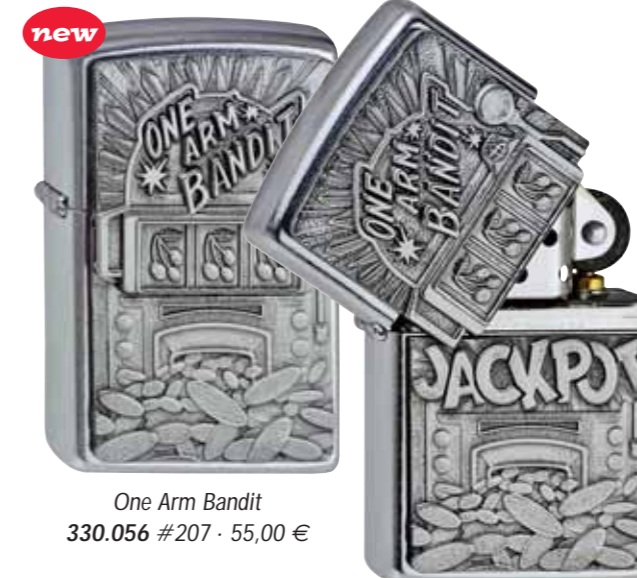
One Arm Bandit 330.056 #207 · 55,00 €