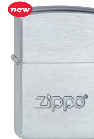
new Zippo Logo 430.007 #207 · 33,50 €