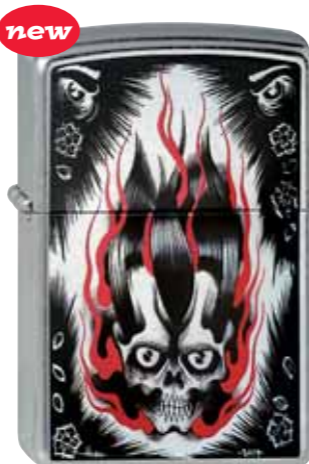
Soul Crusher 230.027 #207 · 45,00 €