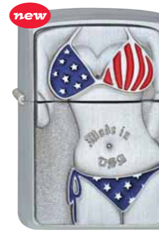
new American Vixen 320.045 #205 · 59,50 €