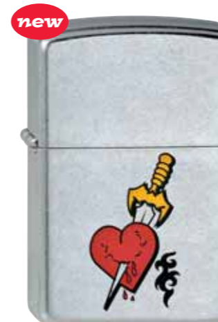
Dagger Tattoo 230.035 #207 · 29,50 €