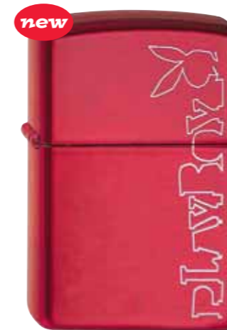
Playboy Wire 390.016 #21063 · 45,00 €