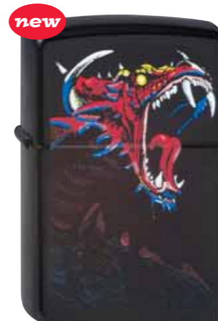
Dragon 290.053 #21064 · 39,50 €