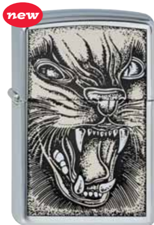
new Wild Cat 210.078 #250 · 45,00 €