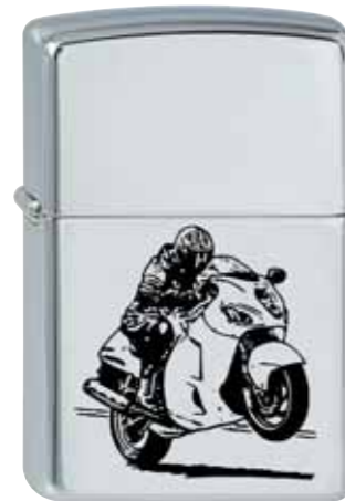
Race Wheelie 210.070 #250 · 35,00 €