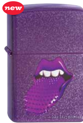
Rolling Stones Spikey 290.044 #21128 · 45,00 €