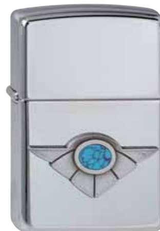
Winged Turquoise 310.059 #250 · 59,50 €