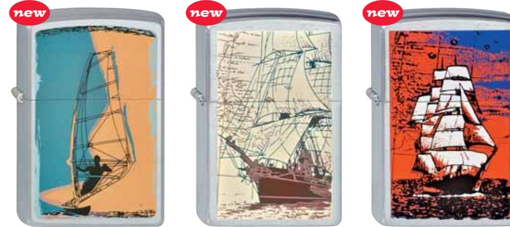
Windsurfer 220.072 #205 · 39,50 €