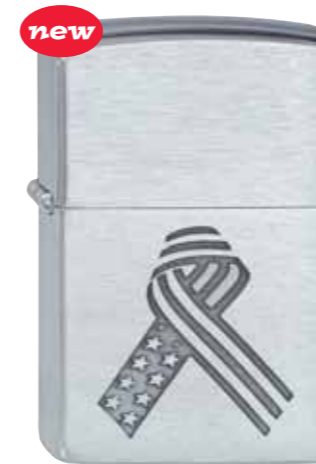
new Stars & Stripes Ribbon 100.130 #200 · 29,50 €