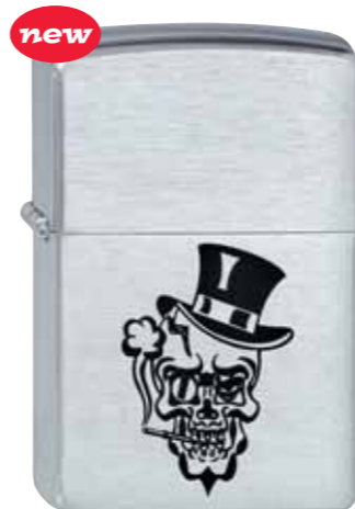
Smoking Skull 200.124 #200 · 29,50 €