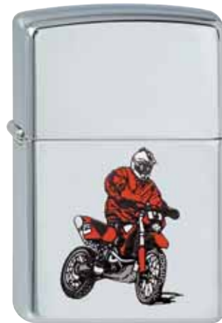
Cross Color 210.069 #250 · 35,00 €