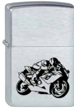
Racer 200.107 #200 · 29,50 €