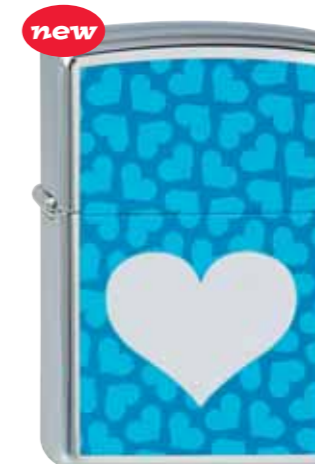
new Chromed Out Heart Turquoise 210.083 #250 · 39,50 €