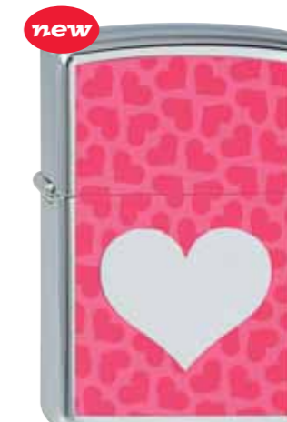
new Chromed Out Heart Pink 210.084 #250 · 39,50 €