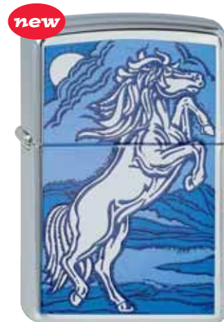
new Rampant Stallion 210.075 #250 · 45,00 €

© 2006 Barrett-Smythe all rights reserved