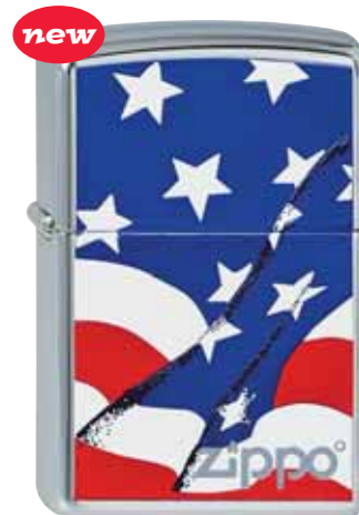
new Wavy Flag 210.073 #250 · 45,00 €