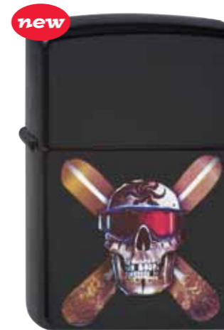
Snow Skull 290.052 #21064 · 39,50 €