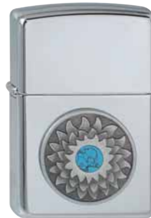
Turquoise Shield 310.058 #250 · 59,50 €