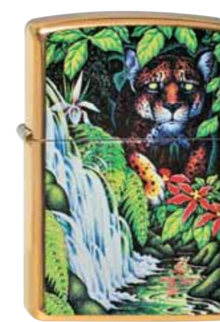
Mystery of the forest 250.001 #254B · 69,50 €

Zippo celebrates the innovative Mysteries of the forest series with a 10 th Anniversary retrospective lighter featuring an alternative piece of art that was submitted, but not used, for the 1995 Collectible of the Year. The 10 th Anniversary lighter is limited to 30,000 consecutive-ly numbered pieces worldwide and packaged in a collectible tin reminiscent of the original Mysteries tin.