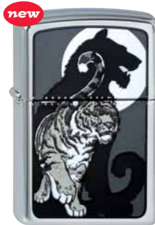
new Tiger with Shadow 210.074 #250 · 45,00 €