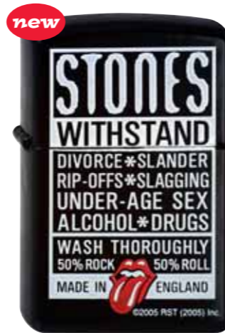
Rolling Stones Withstand 290.046 #21064 · 55,00 €