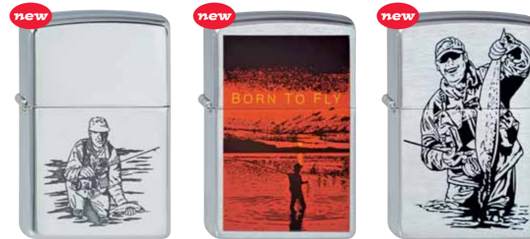
Fisherman No. 1 110.054 #250 · 33,50 €