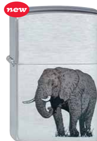
Elephant 200.125 #200 · 29,50 €