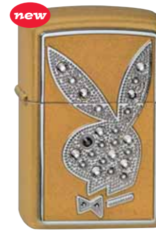
Playboy Bling 350.008 Gold Satin · 110,00 €