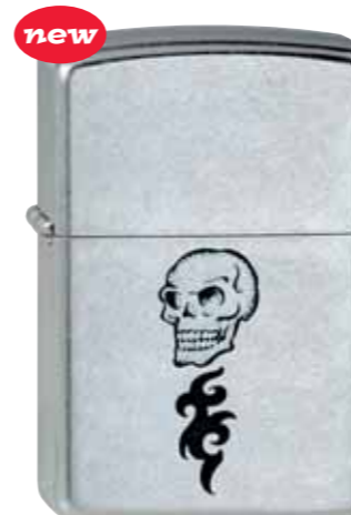
Skull Tattoo 230.032 #207 · 29,50 €