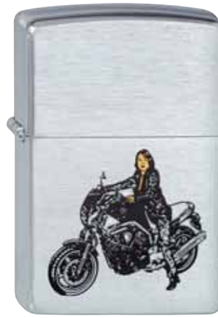
Bike Girl 200.106 #200 · 29,50 €