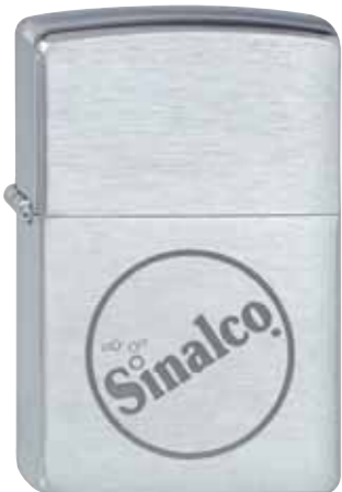
Sinalco 100.125 #200 · 35,00 €