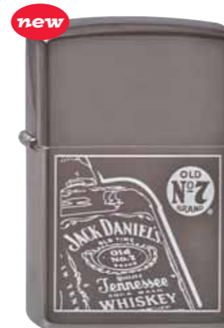
Jack Daniel's Bottle 240.066 #150 · 45,00 €

JACK DANIEL'S and OLD No. 7 are registered trademarks used under license to Zippo Manufacturing Company. © 2004, Jack Daniel's - All Rights Reserved. Your friends at Jack Daniel's remind you to drink responsibly.