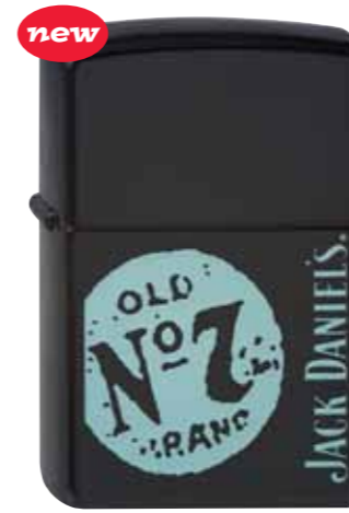
Jack Daniel's Old No. 7 290.048 #21064 · 39,50 €