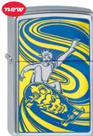
new Skate Boarder 230.028 #207 · 39,50 €