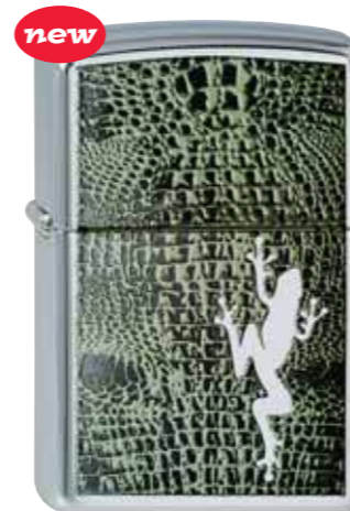
Skin-Frog 210.081 #250 · 39,50 €