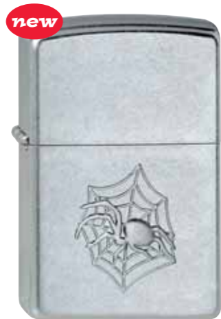
Web Walker 430.006 #207 · 33,50 €