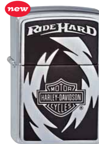
new Harley-Davidson Ride Hard 300.100 #200 · 69,50 €

HARLEY-DAVIDSON OFFICIAL LICENSED PRODUCT