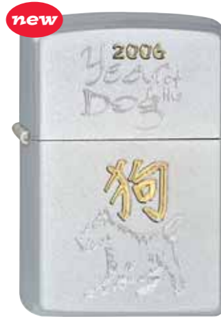
2006 Year of the Dog 420.012 #205 · 35,00 €