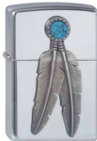
Feathered 310.056 #250 · 59,50 €