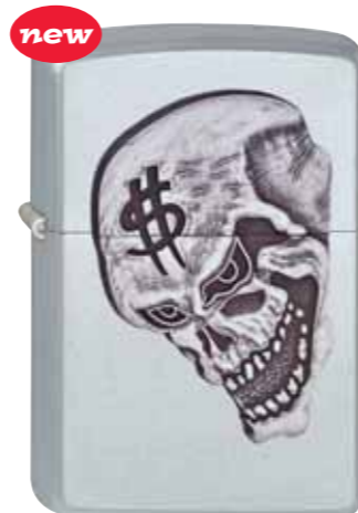
Money On My Mind 320.044 #205 · 59,50 €