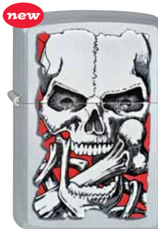
new Down the Hatch 220.069 #205 · 39,50 €