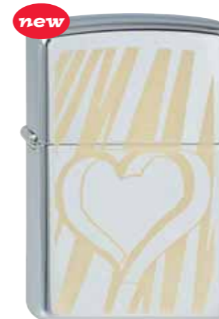
new Hearts / Slashes 410.107 #250 · 39,50 €