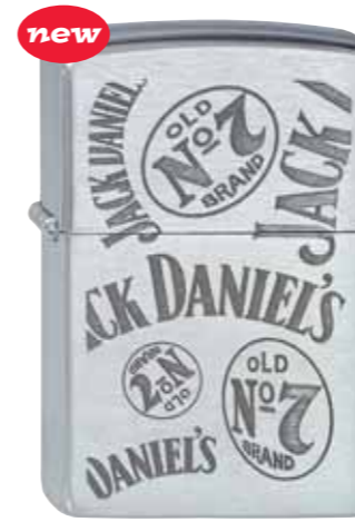
Jack Daniel's All Over 100.128 #200 · 45,00 €