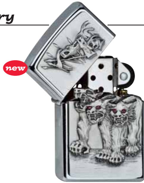
Werewolf 300.111 #200 · 45,00 €