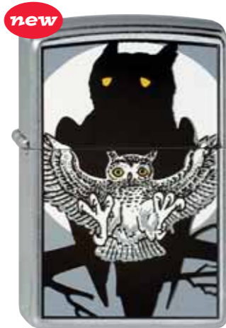
new Owl with Shadow 230.029 #207 · 39,50 €