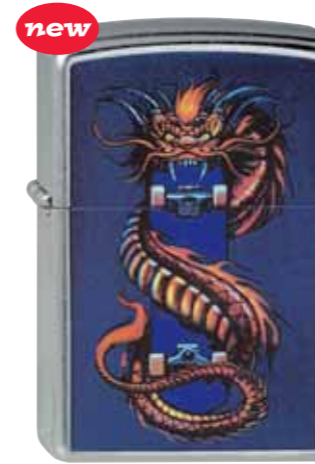
Skate-Dragon 230.039 #207 · 39,50 €