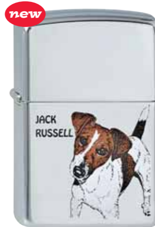
Christines Jack Russell 210.080 #250 · 35,00 €