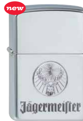
Jägermeister 410.109 #250 · 39,50 €