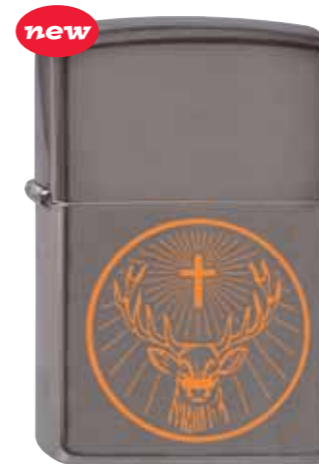
Jägermeister Hirsch 240.069 #150 · 45,00 €