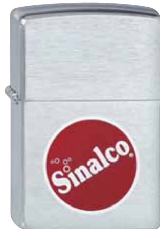
Sinalco 200.101 #200 · 35,00 €