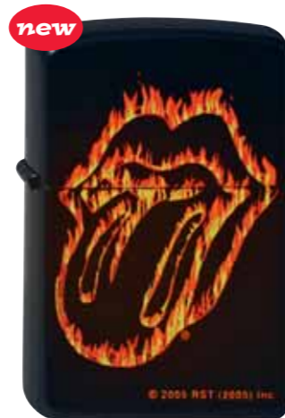
Rolling Stones Flaming Tongue 290.049 #21129 · 45,00 €