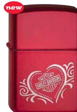
new Harley-Davidson Heart 490.029 #21063 · 39,50 €

© 2004 Harley-Davidson All Rights Reserved. Manufactured by Zippo under license from Harley- Davidson Motor Company