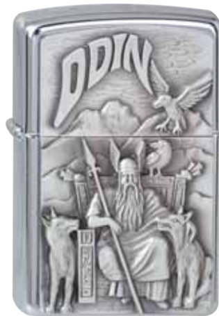
Odin 300.097 #200 · 39,50 €