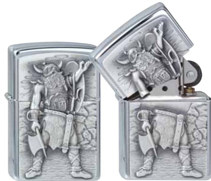
Conquerer 300.099 #200 · 39,50 €