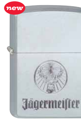
Jägermeister 420.013 #205 · 35,00 €