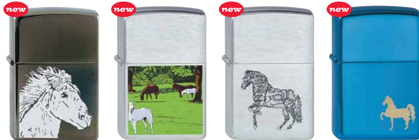
Horse 240.068 #150 · 45,00 €