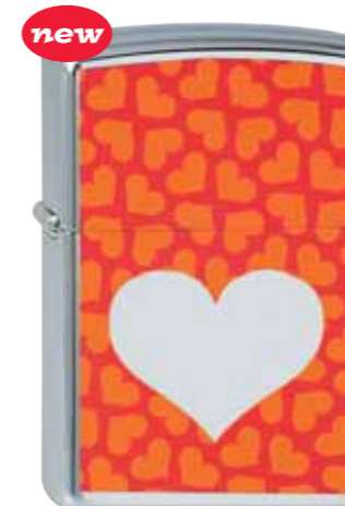
new Chromed Out Heart Orange 210.082 #250 · 39,50 €