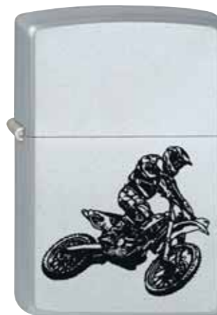
Cross Bike 220.067 #205 · 00,00 €