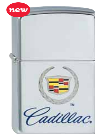
Cadillac 210.072 #250 · 39,50 €

Elvis and Elvis Presley are registered trademarks with the USPTO. © 2004 E.P.E. www.elvis.com