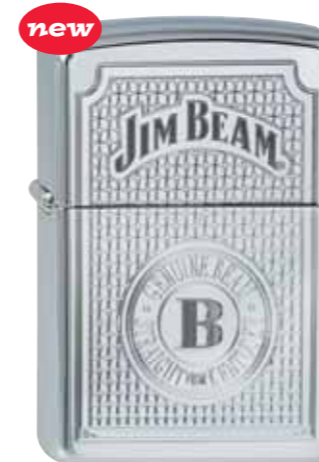
Jim Beam Genuine 410.108 #250 · 45,00 €