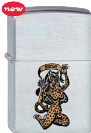
Meow 200.123 #200 · 29,50 €