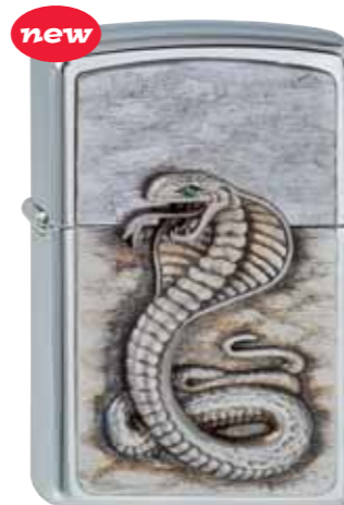
Green Eyed Cobra 300.109 #200 · 45,00 €