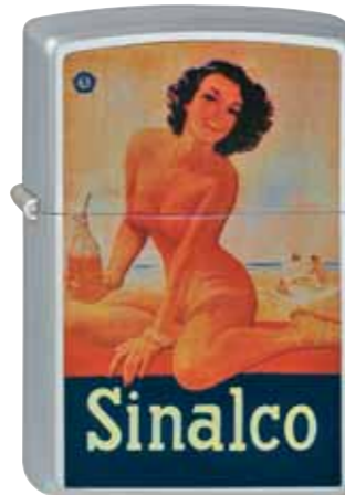
Sinalco Girl 220.066 #205 · 45,00 €