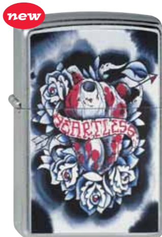
Heartless 230.026 #207 · 45,00 €