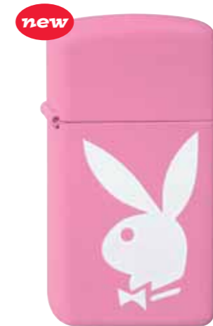
Playboy Pink 270.019 #1638 · 39,50 €