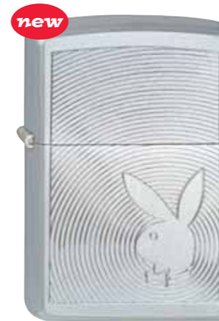
Playboy Bunny Wave 420.010 #205 · 39,50 €

© 2005 Playboy PLAYBOY and RABBIT HEAD DESIGN are marks of and used under license from Playboy Enterprises International, Inc. by ZIPPO Manufacturing Co., Bradford, PA, USA