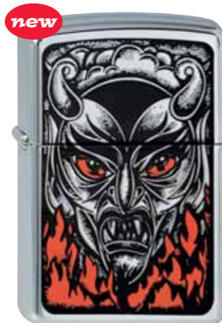
new Fire Down Below 210.079 #250 · 45,00 €