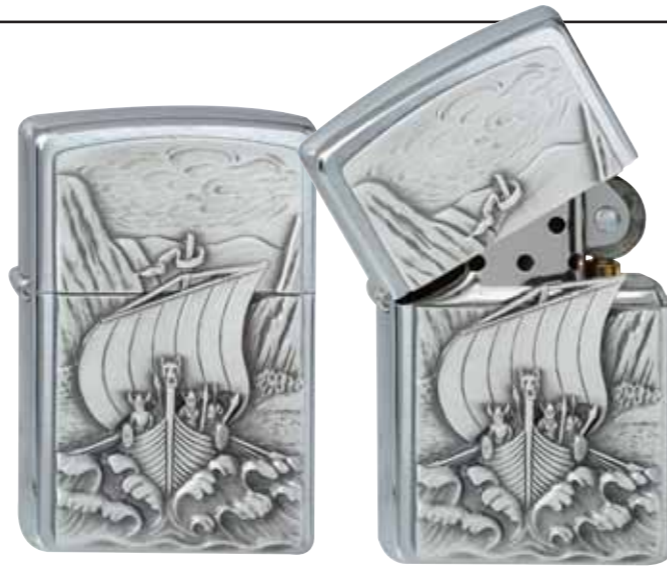
Viking Fjord 300.093 #200 · 39,50 €