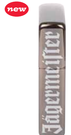
Jägermeister Edges 440.123 #150 · 45,00 €