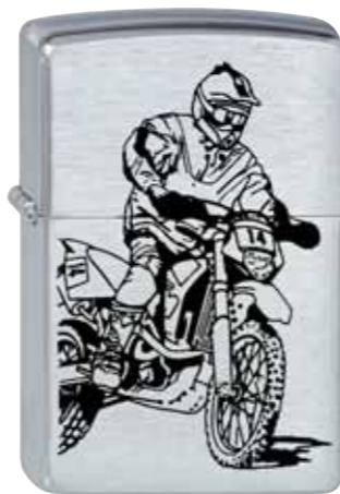
Cross 200.108 #200 · 35,00 €