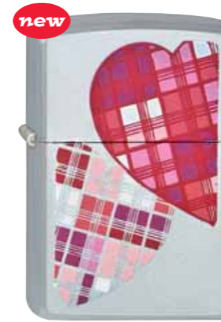
new Plaid Hearts 220.071 #205 · 39,50 €