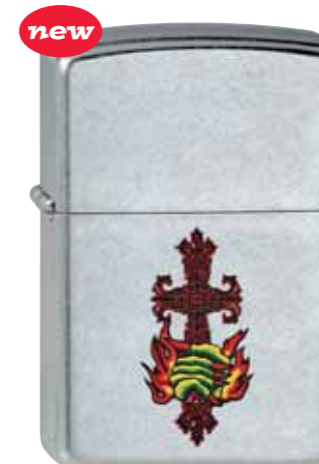
Flaming Cross Tattoo 230.036 #207 · 29,50 €