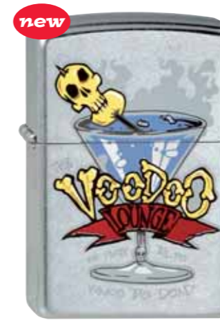
Voodoo-Lounge 230.038 #207 · 39,50 €