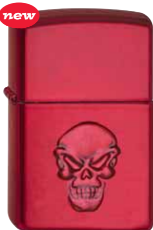
Doom 490.030 #21063 · 39,50 €