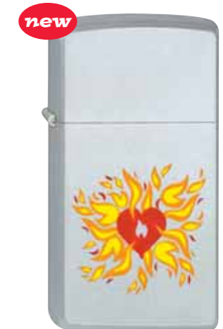
new Flaming Zippo Heart 270.020 #1605 · 29,50 €