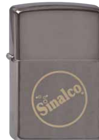
Sinalco 440.119 #150 · 45,00 €