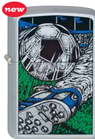
new Soccer 220.070 #205 · 39,50 €