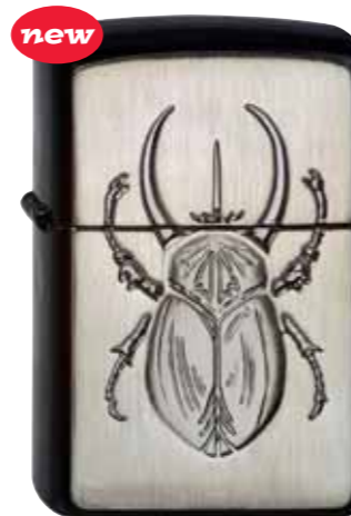
Scarab 390.015 #21064 · 55,00 €