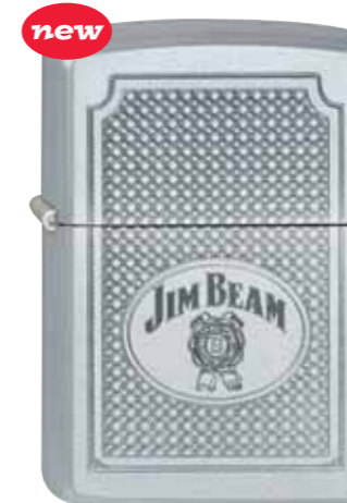
Jim Beam Logo 420.011 #205 · 39,50 €