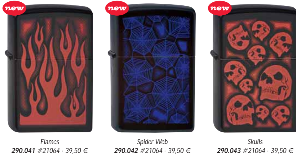
Flames 290.041 #21064 · 39,50 €