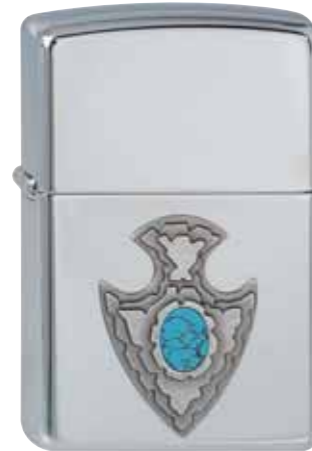
Blooming Turquoise 310.057 #250 · 59,50 €