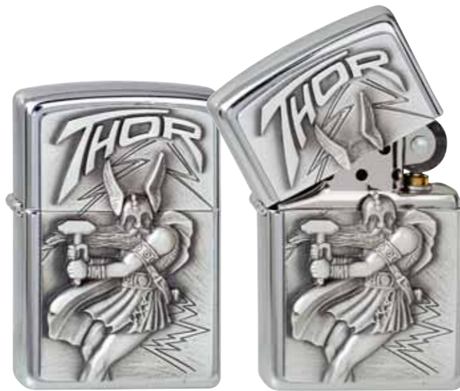
Thor 300.098 #200 · 39,50 €