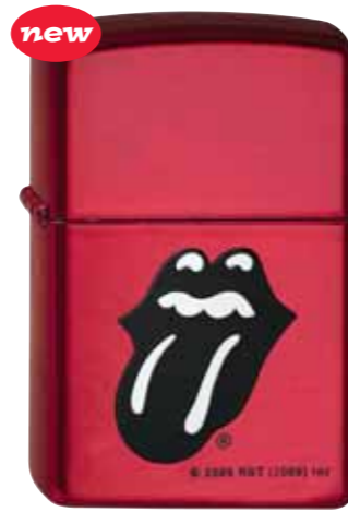
Rolling Stones Tongue 290.045 #21063 · 45,00 €

© 2006 RS Tours Inc. Under License to TNA