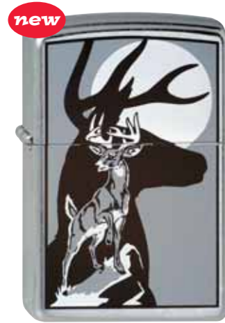
new Deer with Shadow 230.030 #207 · 39,50 €