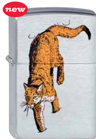
Puma 200.120 #200 · 39,50 €