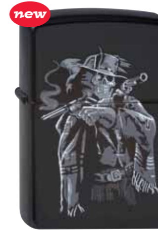
Cowboy 290.051 #218 · 39,50 €