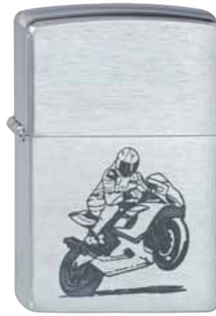
Motorcycle Wheelie 100.127 #200 · 29,50 €