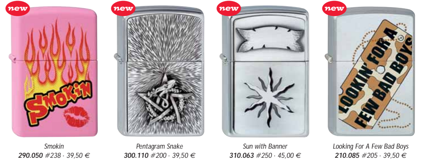
Smokin 290.050 #238 · 39,50 €