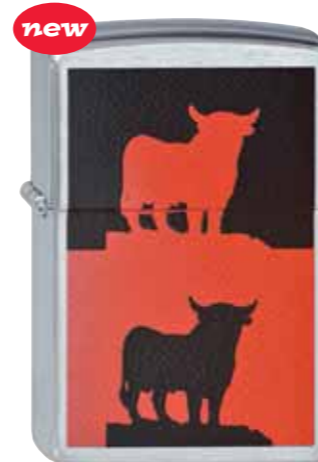
Taureaux 200.121 #200 · 33,50 €