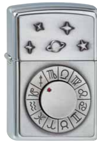
Astro Lighter 900.831 #250 · 69,50 €